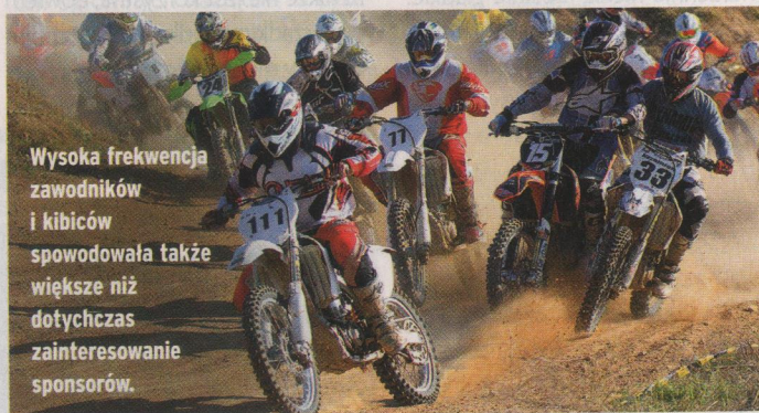
Wysoka frekwencja zawodników i kibiców spowodowała także większe niż dotychczas zainteresowanie sponsorów.

pocieszenie dodajmy, że ich dominacja nie objęła klasy quadów... ale w tej klasie akurat nie startowali. Może nasi zawodnicy powinni częściej jeździć za wschodnią granicę? Nie zawiedli kibice. Co więcej, tegoroczny cykl cieszył się większym niż dotychczas zainteresowaniem sponsorów. Na przedostatniej run-